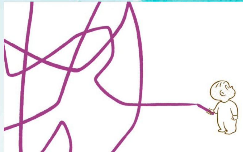
Illustrazione di Crockett Johnson

Quando un tratto di matita inizia la sua corsa ma non sa dove andrà a finire... tutto può accadere! Vi aspettiamo per condividere insieme momenti di grande divertimento tra lettura, gioco e creatività , gli elementi base di questo percorso artistico che vedrà genitori e bambini lavorare insieme per dar forma a piccoli scenari e per realizzare una grande storia collettiva.