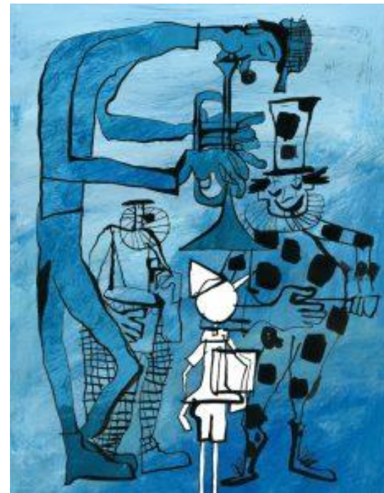
Illustrazione di Gek Tessaro