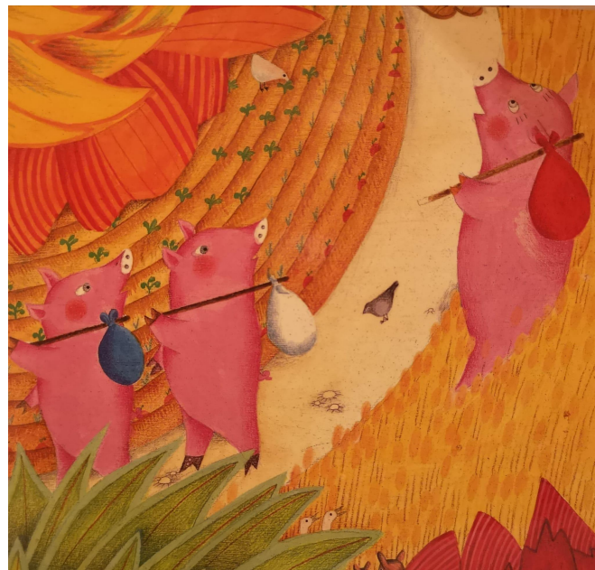
Illustrazione di Sophie Fatus

La sonorizzazione è realizzabile anche a scuola